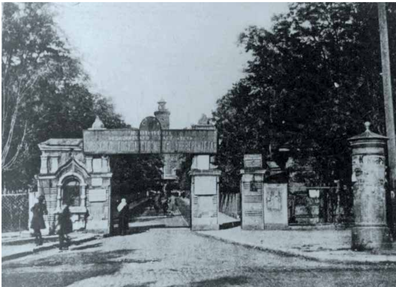
Вход в университетские клиники Донского университета. Entrance into the university clinics of the Don University.