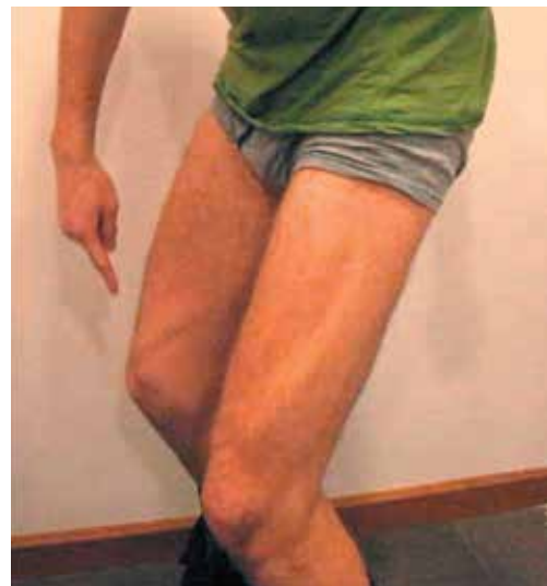
Рис. 2. Пациент Г., 28 лет. Болезненные крампи в мышцах передней группы бедра с обеих сторон после нескольких приседаний, с задержкой расслабления до нескольких минут, в результате чего пациент остается в вынужденной позе

Fig. 1. Patient G., 28 years old. Atrophy of the tongue muscles